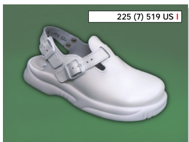
225 (7) 519 US I