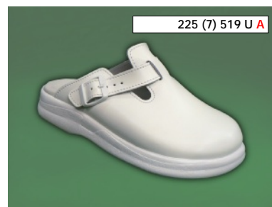
225 (7) 519 U A