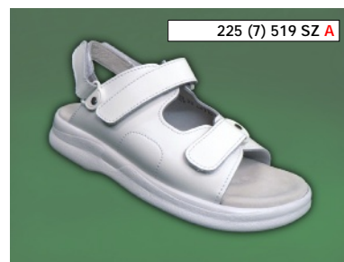
225 (7) 519 SZ A