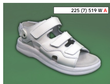
225 (7) 519 W A