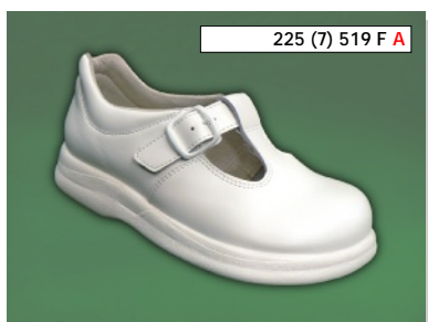
225 (7) 519 F A

PROVEDENÍ PODEŠVE (doplňte do čísla vzoru):