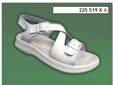
225 519 X A