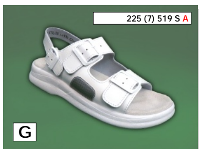
225 (7) 519 S A