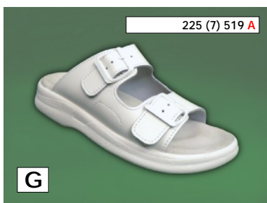
225 (7) 519 A