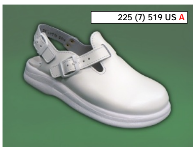
225 (7) 519 US A