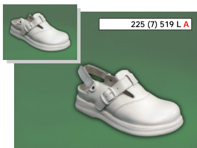
225 (7) 519 L A