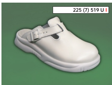
225 (7) 519 U I