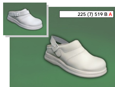
225 (7) 519 B A